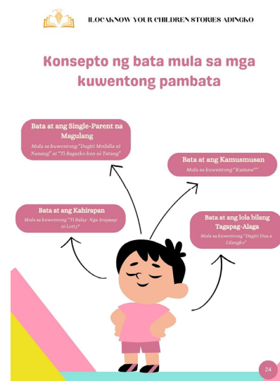
Larawan 1. Kagamitang Nabuo mula sa mga nasuring kuwentong pambata

Mula sa isinagawang pagsusuri, nakabuo ang mga mananaliksik ng kagamitang pampagtuturo, na naglalaman ng buod ng mga kuwentong sinuri, ang diskusyon kung ano ang naganap sa kuwento, mga katanungan na pwedeng sagutan ng mga mag-aaral, at ang nabuong konsepto ng bata.